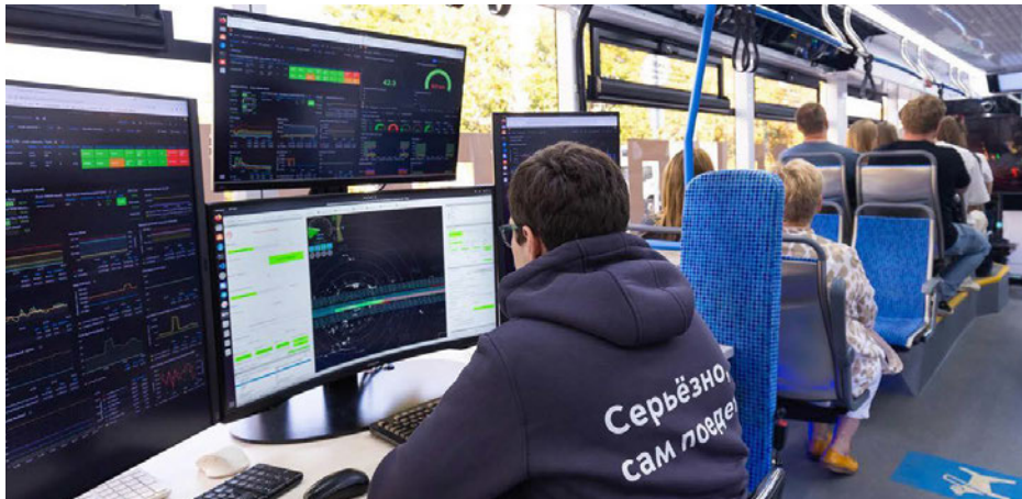
Die Test-Straßenbahn im Fahrgastbetrieb

In Moskau, Russland, hat eine für den fahrerlosen Betrieb umgerüstete Straßenbahn der regulären Linie 10 nun den Testbetrieb mit Fahrgästen aufgenommen. In der ersten Testphase vom 23. Mai bis zum 29. August dieses Jahres wurden keine Fahrgäste befördert. Die Straßenbahn legte in Phase 1 mehr als 800 km auf der Linie 10 zwischen der Metro-Station Schukinskaja und der Kulakowa Straßen zurück, um zu prüfen, ob die geforderte Geschwindigkeit auch in Kurven und Weichen eingehalten wird, und ob an bestimmten Punkten angehalten, Hindernisse erkannt und Notbremsungen durchgeführt werden. Dabei war ein Fahrzeugführer an Bord, der jederzeit hätte eingreifen können (s. Rail Impacts vom 06.06.2024). Der Betreiber Moskau Metro und das russische Centre for Electric Transport & Driverless Technologies haben die einteilige Straßenbahn mit sechs Kameras sowie vier LiDAR- und drei Radarsystemen ausgestattet, die eine 3D-Karte der Umgebung zur Navigation und Identifizierung von Objekten erstellen. Wie Moskau Metro Anfang September mitteilte, läuft jetzt die zweite Testphase, in der die Straßenbahn autonom fährt und auch das Öffnen und Schließen der Türen übernimmt. Ein Fahrzeugführer überwacht das autonome System, zusätzlich werden auf einem Bildschirm verschiedene Leistungsdaten angezeigt.