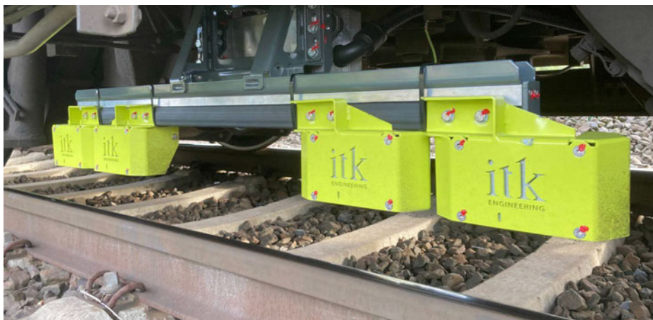
Am Zugfahrzeug montierte MAROS-Sensoren

Für eine Kapazitätserhöhung auf bestehender Infrastruktur durch Erhöhung der Zugtaktung ist eine unmissverständliche und sichere Lokalisierung des einzelnen Zuges unerlässlich: Je exakter der Zug lokalisiert werden kann, desto flexibler und kürzer können die Zugfolgezeiten ausfallen. Die Lokalisierungslösung MAROS (Magnetic Railway Onboard Sensor) von ITK Engineering bestimmt die Position eines Zuges mithilfe des magnetischen Fingerabdrucks der Schiene. Hierzu wird ein Sensor an der Unterseite des Zugfahrzeugs angebracht, der während der Fahrt mittels des magnetischen Feldes die ferromagnetischen Eigenschaften der jeweiligen Gleisabschnitte misst. Diese sind so individuell wie ein menschlicher Fingerabdruck und können daher auf jedem Abschnitt einer klaren Position zugeordnet werden. Die individuelle Ortssignatur wird in Echtzeit während der Fahrt permanent einer exakten geographischen Position zugeordnet. Das geschieht mit einer von ITK entwickelten Software-Lösung inklusive intelligenter Algorithmen. Initial muss jede Bahnstrecke zunächst einmal abgefahren und vermessen werden, bevor diese magnetischen Daten mit dem Kartenmaterial der Streckenortslage übereinandergelegt werden.